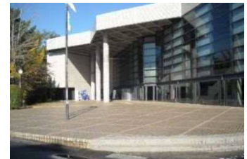
浜北文化センター

浜北文化センターが開館40年を経過したことから、大規模改修を行うための実施設計をします。