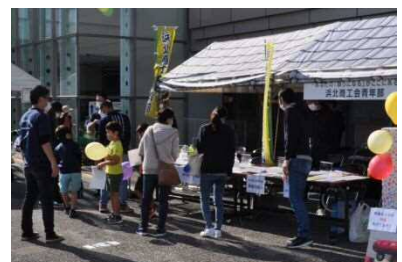
令和3年度に実施した地域力向上事業 「シン・発見！体験！実感！ いいね♪はまきた」

住みよい地域を実現するため、団体からの提案に基づき、市が公益上の必要を認め、団体が主体的に取り組む事業に対し助成します。