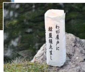
万葉の森公園(万葉まつりの様子)