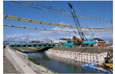
一般県道 細江浜北線(雷神橋)