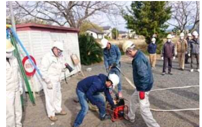
令和3年度 地域防災訓練

河川の氾濫が起きそうな時に、余裕をもって逃げるために事前に考えておく、一人ひとりの生活に合ったオリジナルの避難行動計画。