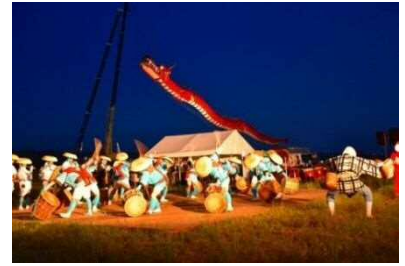
遠州はまきた飛竜まつり