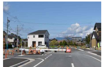
都市計画道路 美園線