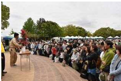
はまきたグリーンフェスタ

地域の活性化や文化振興のため、市民協働の視点を取り入れて、はまきたグリーンフェスタ(令和4年度は新型コロナウイルス感染拡大防止のため中止)、浜北産業祭、浜北植木まつり開催に係る経費を一部負担するとともに、浜北区市民文化祭などを実施します。