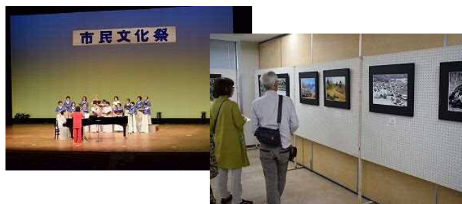
浜北区市民文化祭

※記載したイベントなどの事業については、新型コロナウイルス感染拡大防止のため、実施が取り止めになる場合があります。