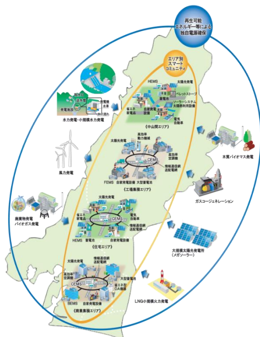
浜松市エネルギービジョン将来イメージ

具体的には、全国トップクラスの日照時間などの恵まれたエネルギー資源を活用した太陽光や風力、バイオマス、小水力などの多様な再生可能エネルギーや、ガスコージェネレーションによる自立分散型電源を最大限導入し、自分たちで使う電力は自分たちで創るとともに、こうした電力を蓄電池や電気自動車などの様々なエネルギー設備やエネルギーマネジメントシステムと連結し、無駄なく賢く利用する都市を目指します。