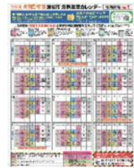
Lịch vứt rác tiếng Nhật

② Vui lòng xem Lịch vứt rác ở khu nhà bạn sống