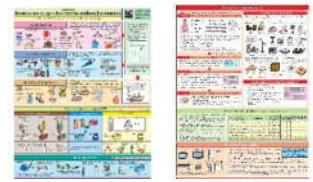
Cách vứt rác/ rác tái chế đúng cách