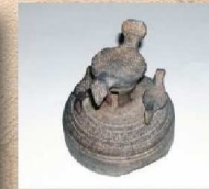
原子森古墳出土鳥形裝飾付須恵器