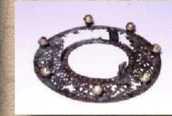
涼ノ御所古墳出土金銅透彫金具(模造)