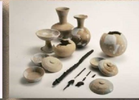
唐沢古墳群出土遺物