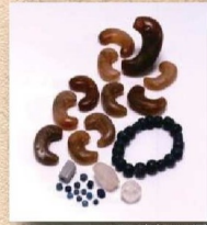
四ツ池古墳群出土遺物