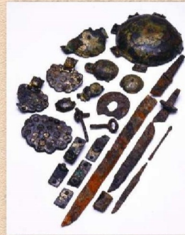
規模古墳群出土遺物

浜松市内で知られている約1,700基の古墳のうち、 9割以上は古墳時代後期(6～7世紀)の横穴式石室 を埋葬施設とする古墳です。本展では、市内の横穴式 石室と出土品について、近年の調査成果を交えて紹介 するとともに、見学が可能な石室の見どころもお伝え します。本展をきっかけに、今も市内に残されている 古墳に関心をお持ちいただき、現地へ訪れることで、 当時の雰囲気を感じていただければ幸いです。