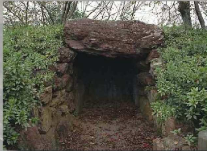
火穴古墳 (西区深萩町・市指定史跡)

浜松市内の横穴式石室を有する古墳を 出土品とともにご紹介しながら、見学 できる石室の見どころもお伝えしま す。ぜひこの機会に現地を訪れていた だき、タイムスリップしたかのような 雰囲気をお楽しみください。