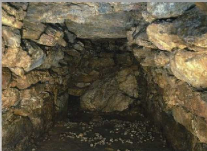
奥寛寺後古墳 (浜北区宮口・市指定史跡)