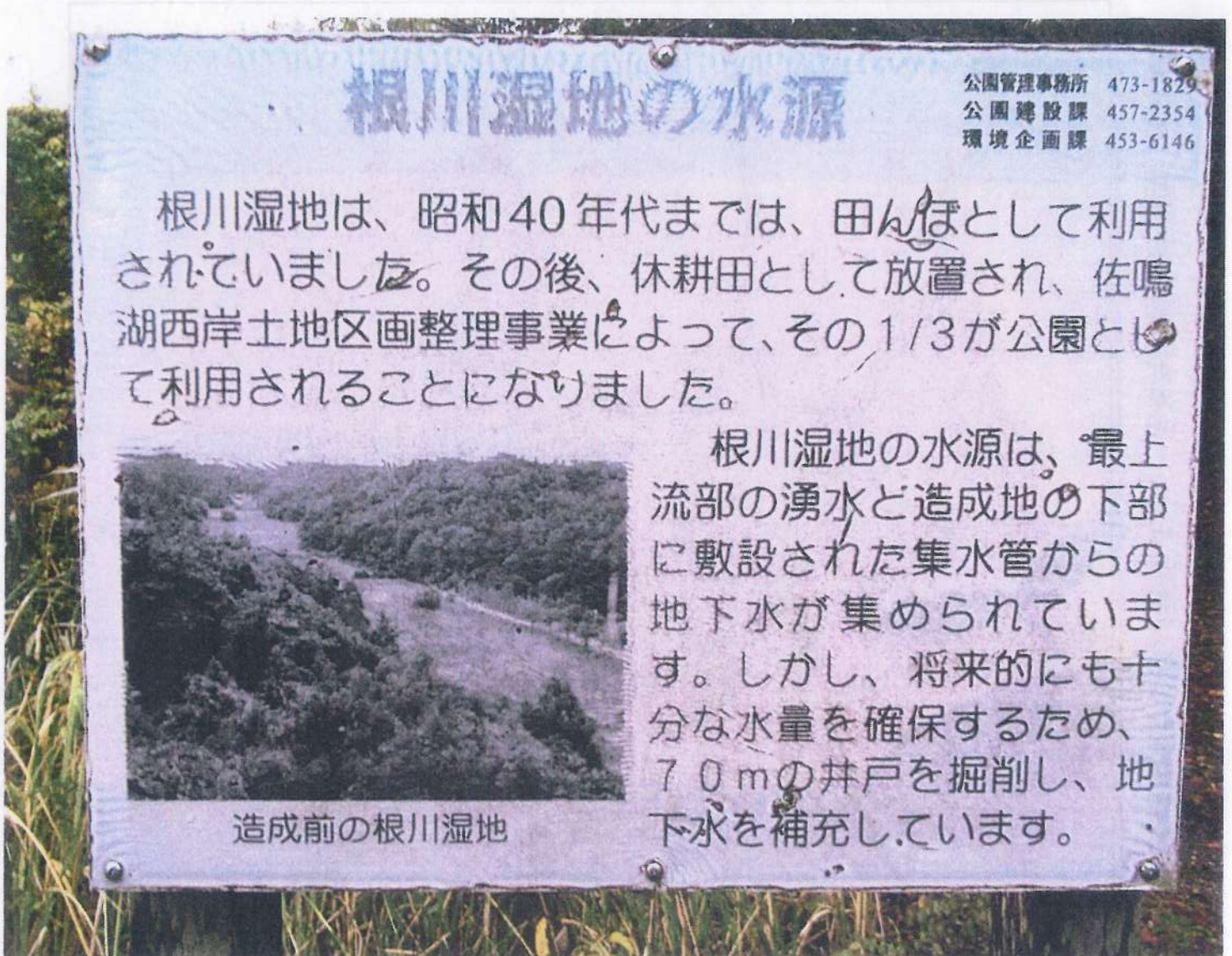
根川湿地に立てられている案内看板 11月22日 『根川湿地の水源地』