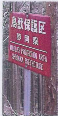
鳥獣保護区 東海自然歩道両側 1km幅