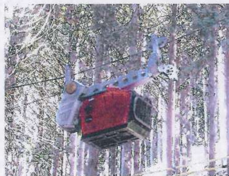
2021, 11 熊地内にて 架線集材 (主索ワイヤーを張り、ラジキャリアで) 搬出路を開設しないで、沢越しに市道横へ集材。 架線は扇型に3方向へ張り替えている。