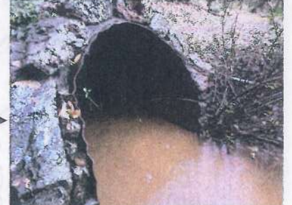
11月22日夕方（雨）造成地下部に敷設された集水管の出口