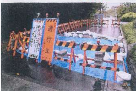
11月22日夕方（雨）市道陥没現場を確認