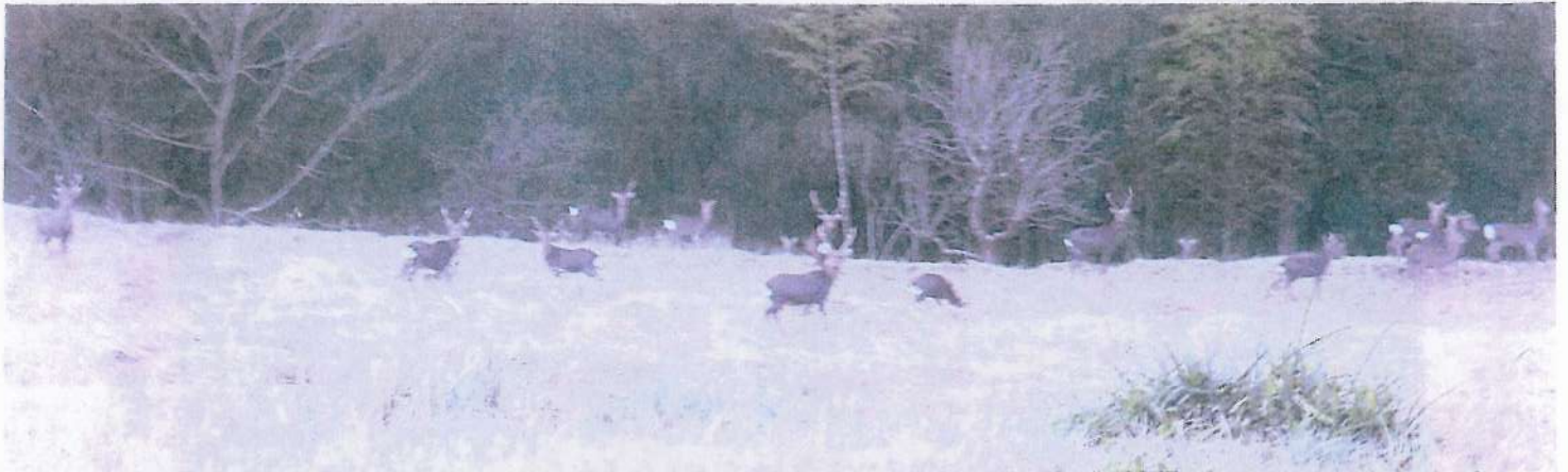
ニホンジカの群れ (16頭) 2021, 3/16 朝6時 天竜区熊・大地野にて 標高 450m (酒井宅前の棚田)