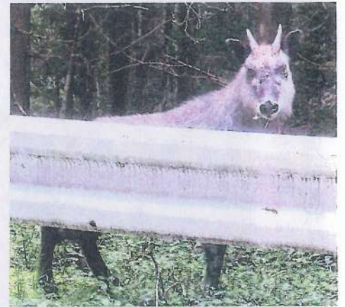
2021、県道横山熊線沢丸地内 ニホンカモシカ