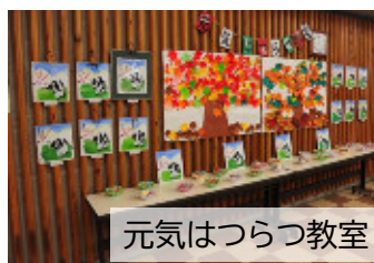
元気はつらつ教室