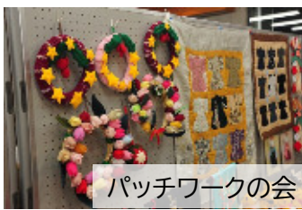
パッチワークの会