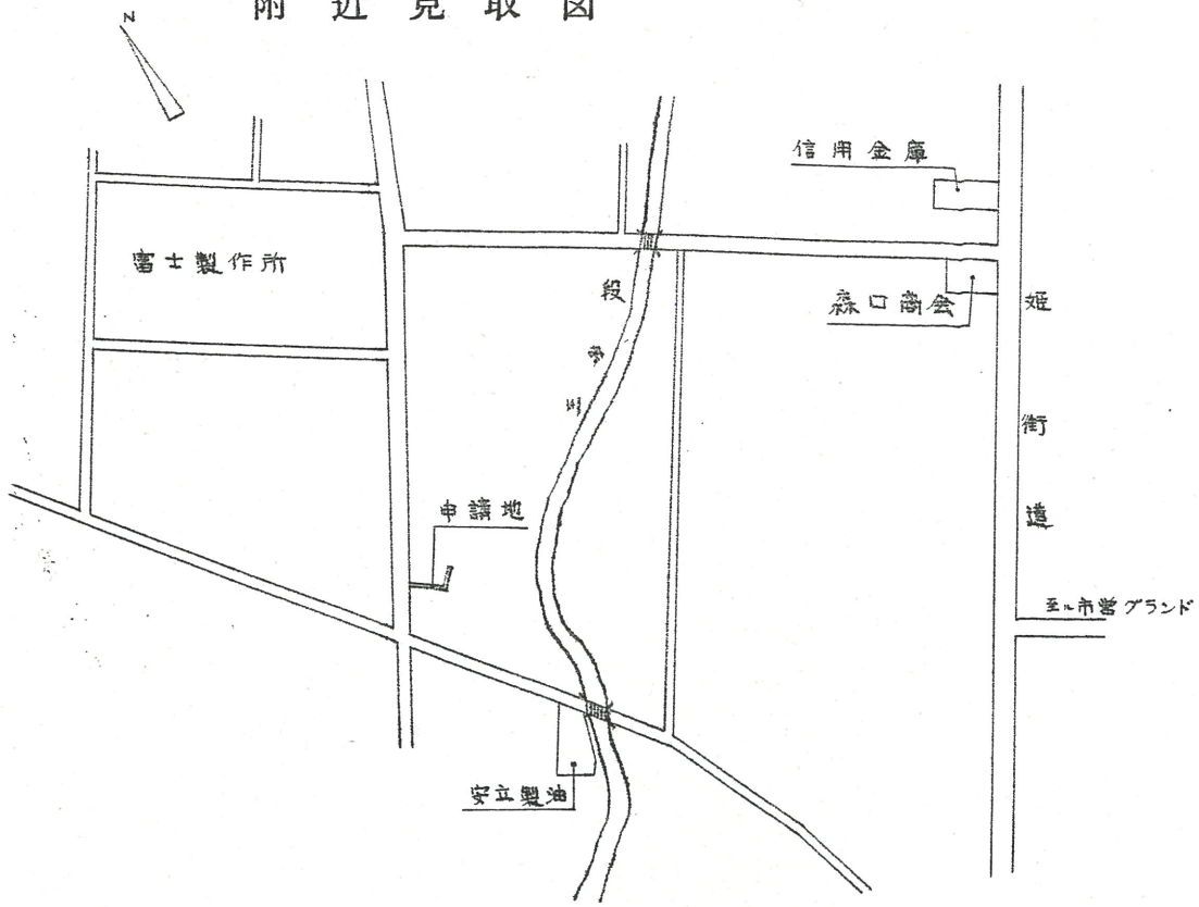
実測図 S: 1/300