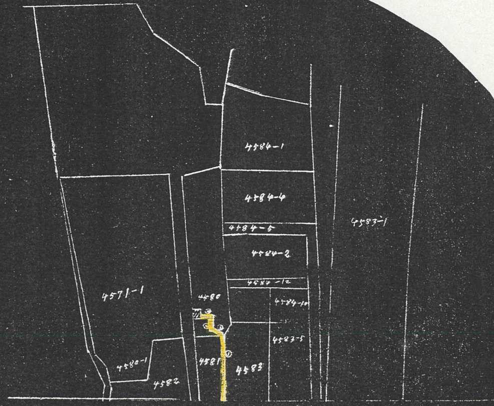
私道指定申請平面図