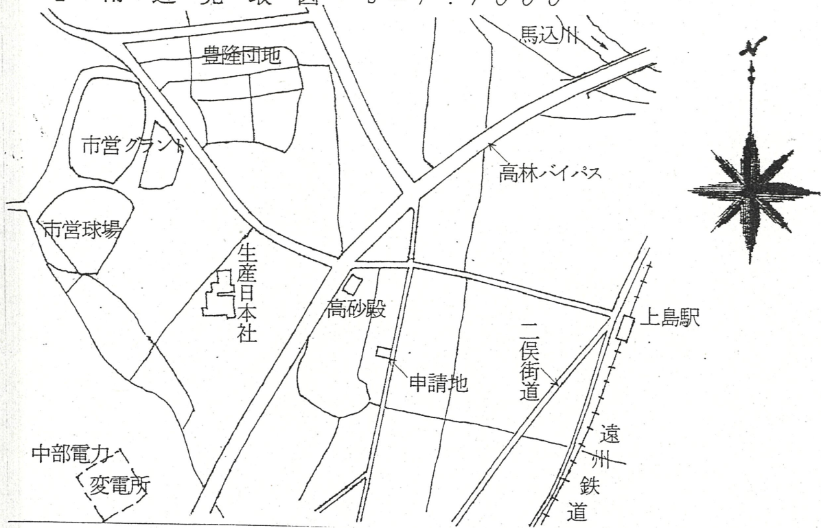
1 附近見取図 S = 1 : 1000