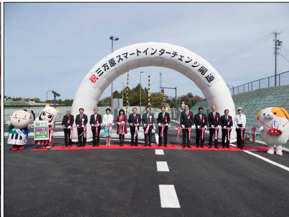
「祝 開通」テープカット