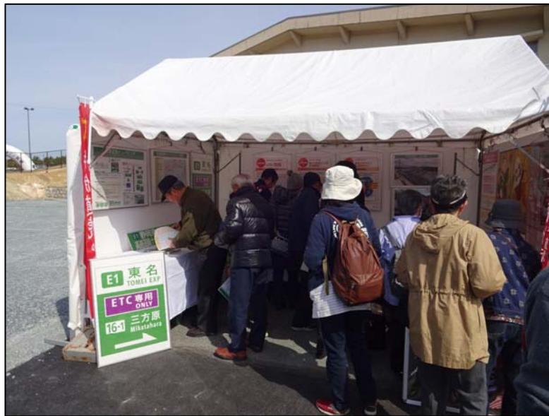
スマートインターチェンジPRブース