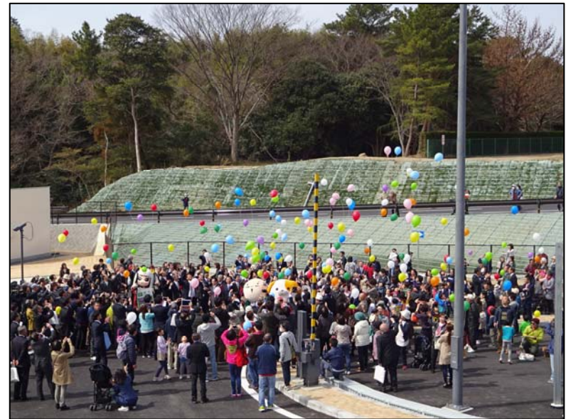
地元住民の皆さんとバルーンリリース