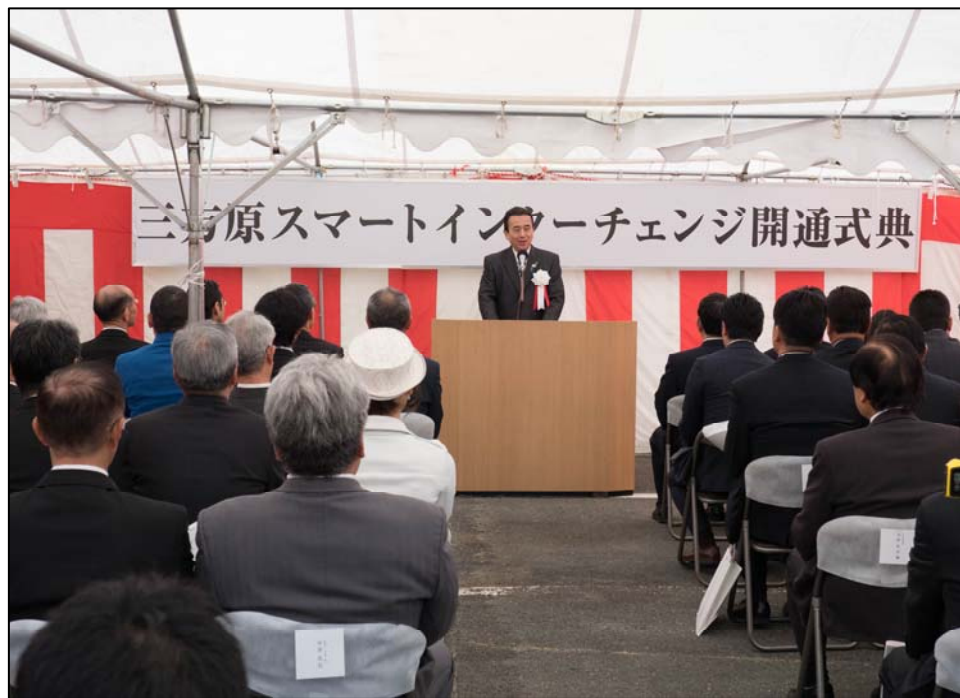
開通式典(浜松市長挨拶)