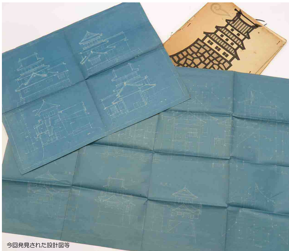
今回発見された設計図等

浜松市が進めている浜松城天守閣展示リニューアル事業に関わり、浜松城復興天守閣（昭和 33 年（1958 年）竣工）に関する資料を探索したところ、現在知られる姿と異なる復興天守閣の設計図面の存在が明らかになりました。