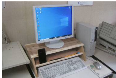
自宅のワークスペースの改善のため天竜材を使用した PC 台を設置