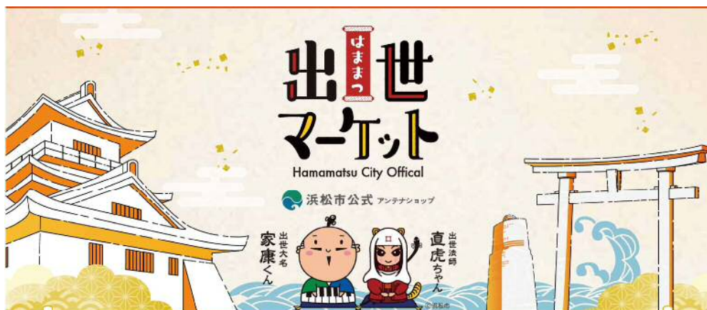
公式オンラインアンテナショップ「はままつ出世マーケット」イメージ