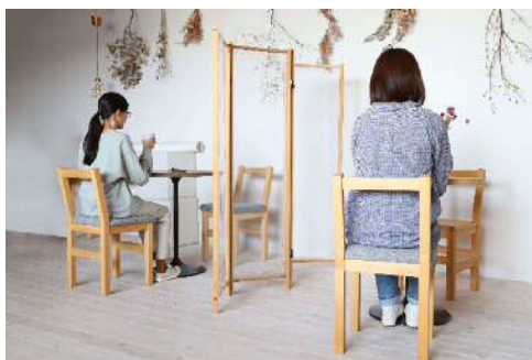
パーティションの設置で生活空間にワークスペースを創出