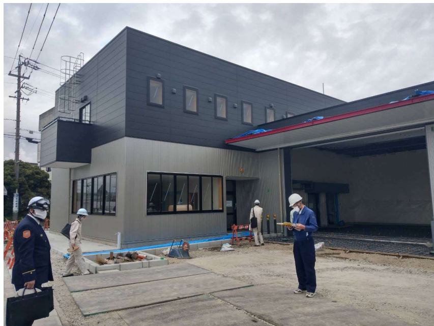
令和3年4月末の状況