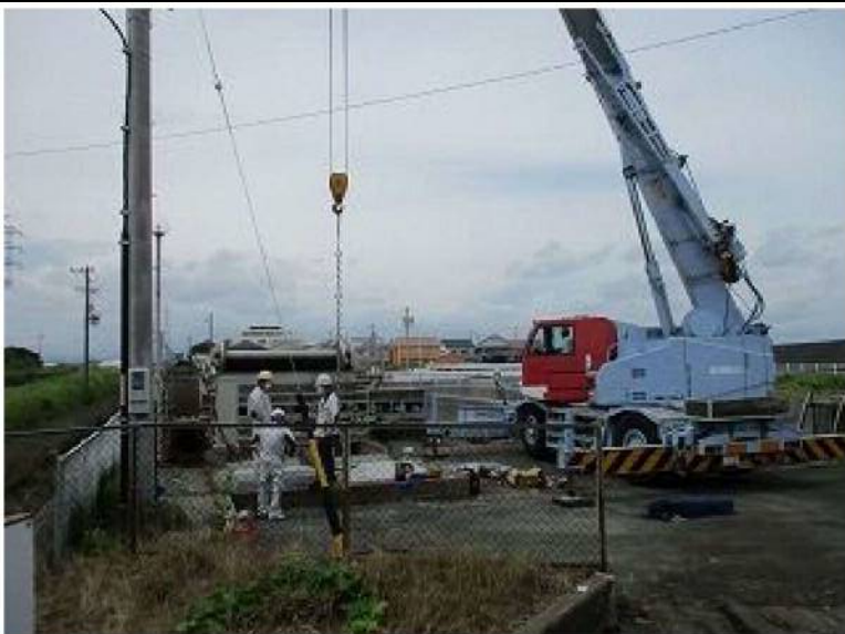
五島東・河輪排水機場（全景） 1号機、2号機とも動作不可