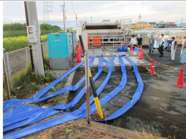
水中ポンプ6台設置