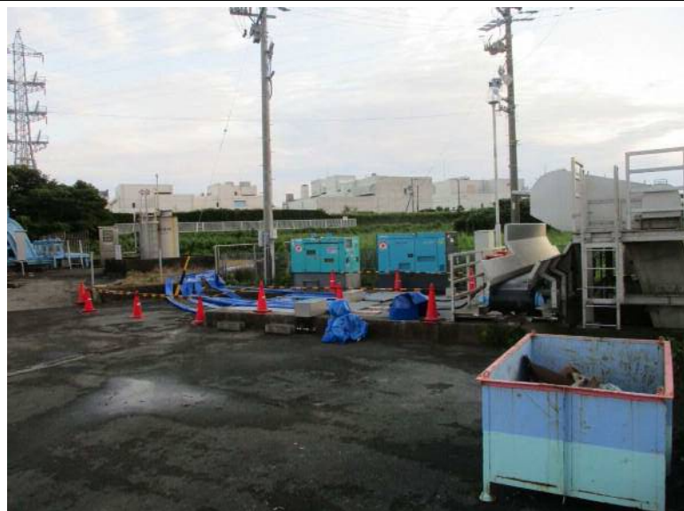
仮設ポンプ施設全景