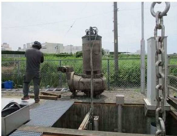
2号機 2号機はモーターも回らない