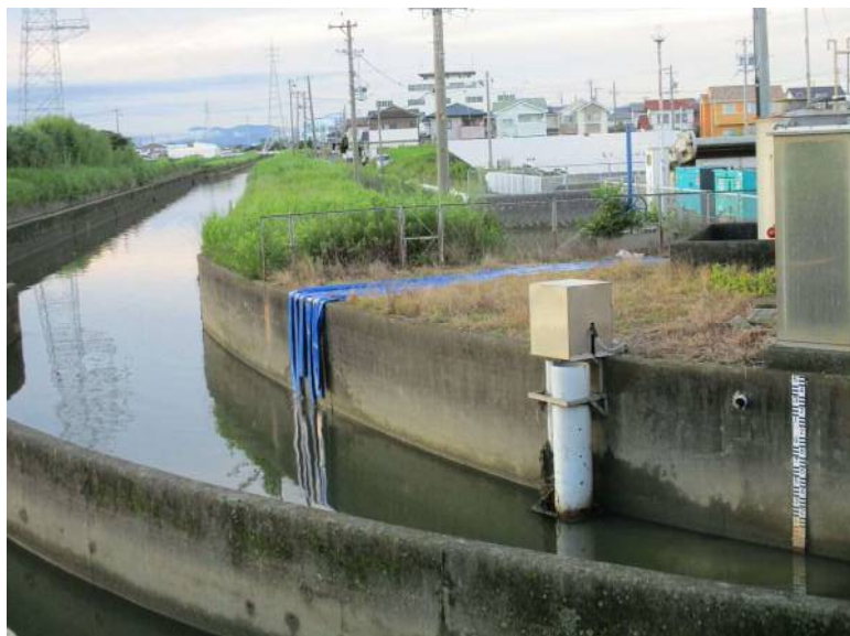
仮設ポンプ排出先の状況