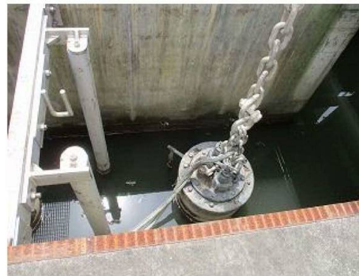
1号機 1号機はモーターは回るも吸水不可