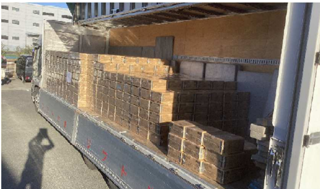
(2) 全体数量が分かる画像

※1枚で全体数量が確認できない場合は、複数枚撮影し、全体数量が確認できるようにすること。