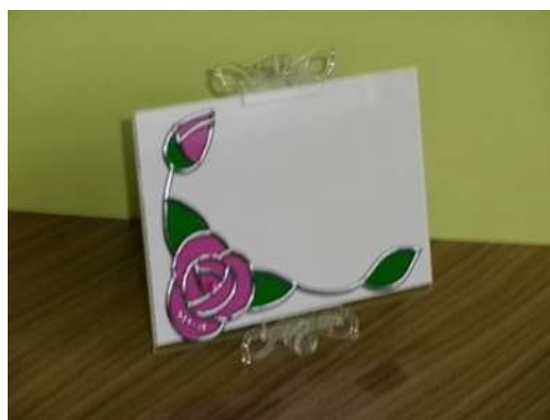
ビーズで飾りつけもできるよ!