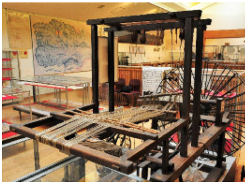
藤布織機(県指定民俗文化財)