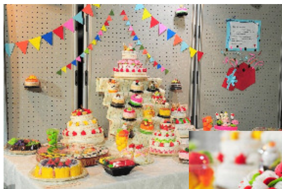
フェルトで作られたお菓子の作品。本当に食べられるかと思ってしまうほどの再現度です。