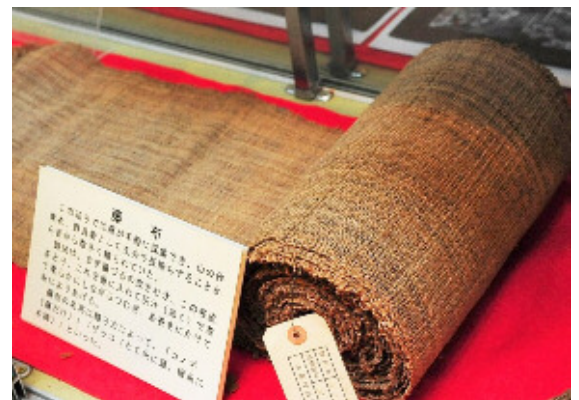
藤布(県指定民俗文化財)