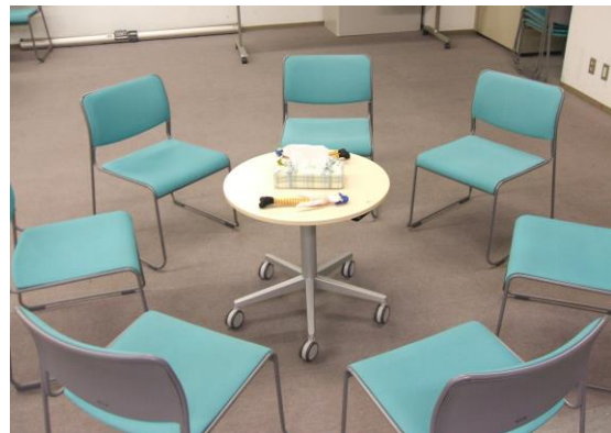
写真のように椅子を丸く並べて語り合いを行っています。