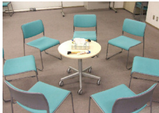
写真のように椅子を丸く並べて語り合いを行っています。