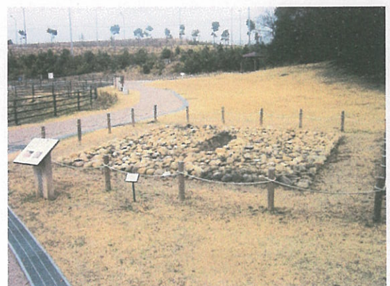
積石塚古墳群 (5世紀後半)