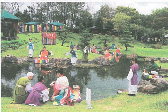
万葉まつり曲水の宴