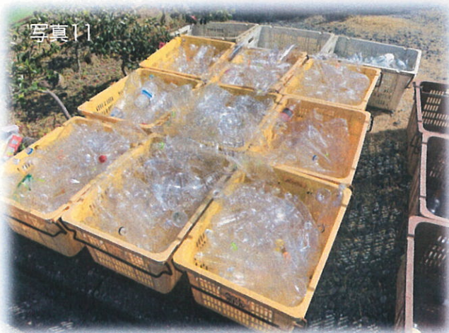
ペットボトル用コンテナ