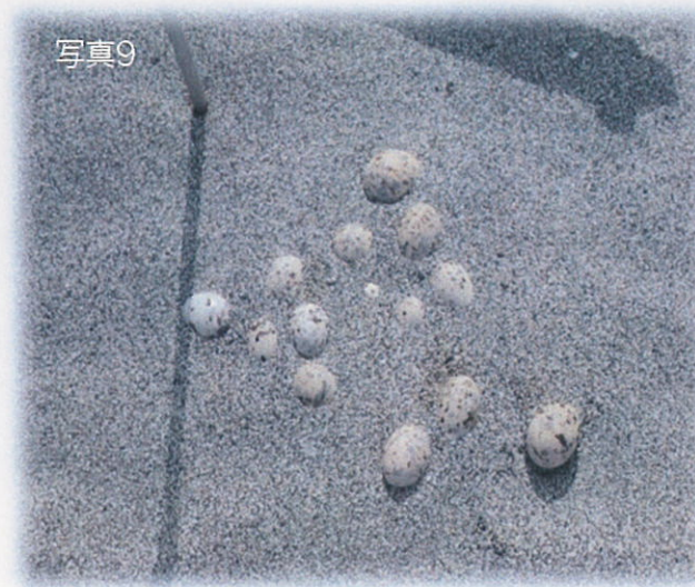
1ヶ所集められた卵