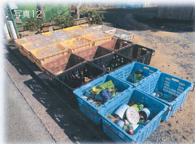
瓶・缶用コンテナ