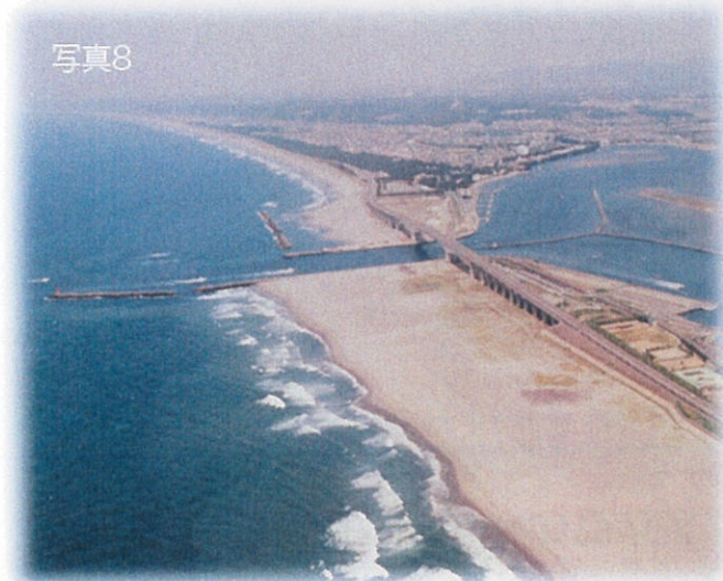
舞阪海岸のコロニー全体