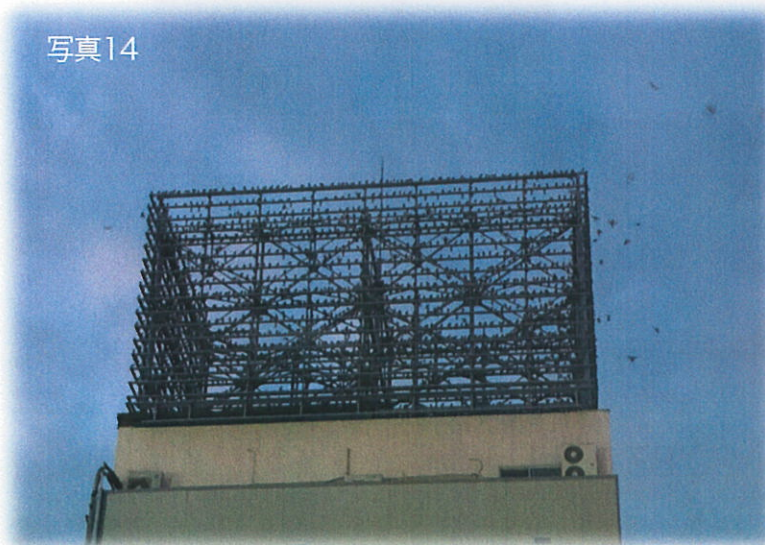
ムクドリが集まるザザシティ前のビル