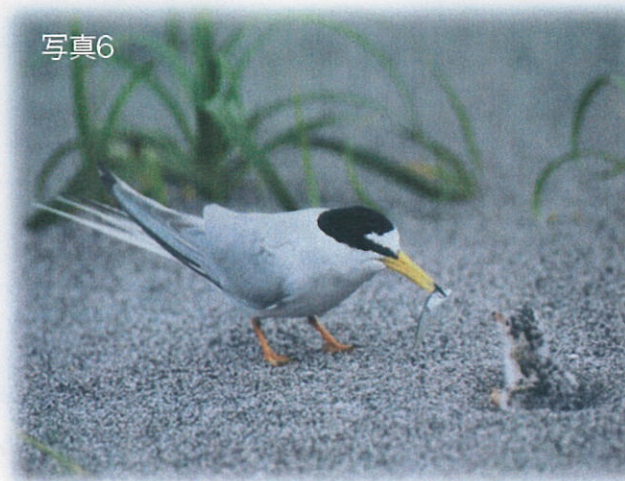
コアジサシの給餌