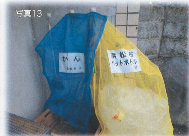
缶・ペットボトル用ネット