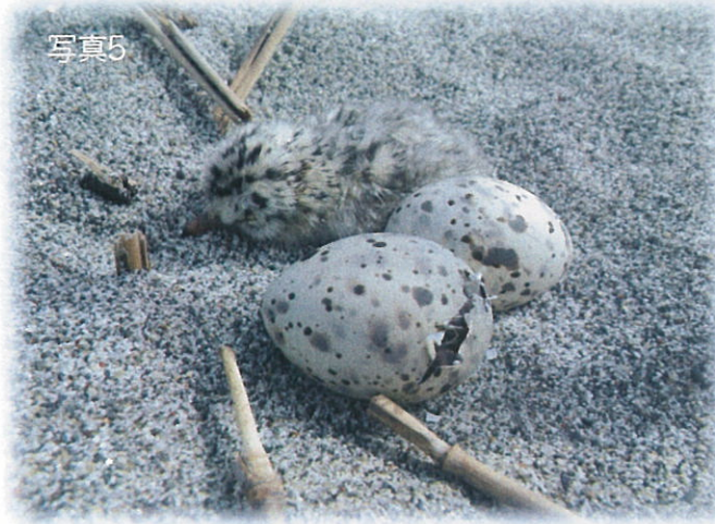
コアジサシの卵とヒナ