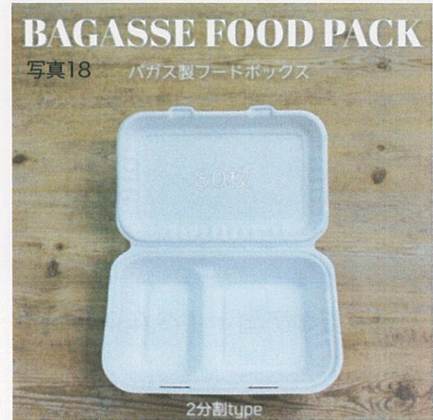
サトウキビ由来 1枚 ¥37