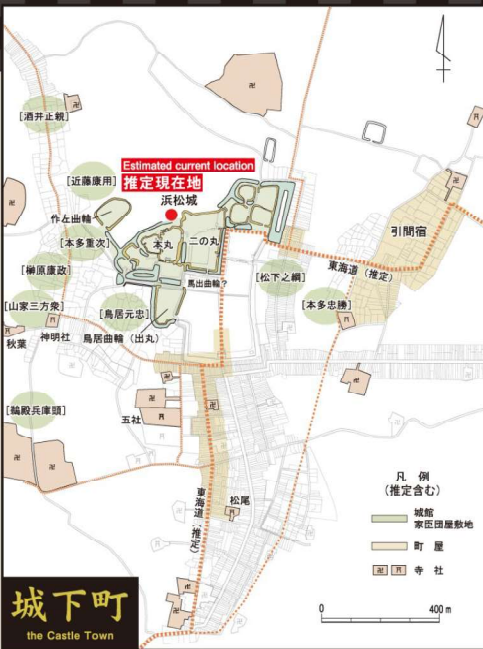
城下町 the Castle Town

元亀元年(1570年)、徳川家康は、岡崎城から引間城に移し、城の根本的な拡張工事を行い浜松城と改名しました。城の中心部を現在の天守の辺りへ移し、引間城は新城の中に組み込まれました。なかでも、天正6年(1578年)頃からの築城工事は大規模なもので、浜松城は家康が新規に築いた城ともいえます。天正14年(1586年)に駿府城へ移るまで浜松城が家康の本拠でした。