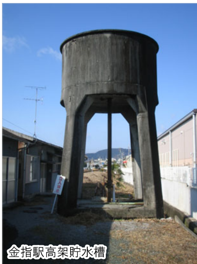
金指駅高架貯水槽

国鉄二俣線西線延伸時の昭和13年から全線開通の昭和15年までは西線の終着駅でした。なかでも、駅舎西側に位置する高架貯水槽は蒸気機関車に給水するために設置され、旅客だけでなく石灰を主力とした貨物の基幹駅としても賑わっていたことを示す貴重な建造物です。