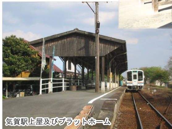
気賀駅上屋及びプラットホーム