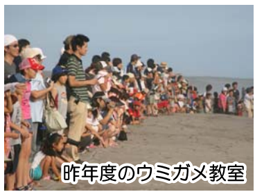
昨年度のウミガメ教室