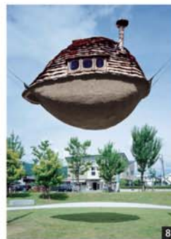
【撮影】 1~5、7、8:増田彰久 6:茅野市美術館