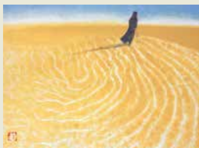
《砂漠のガイド》2001年 浜松市秋野不矩美術館所蔵 / 後期出品