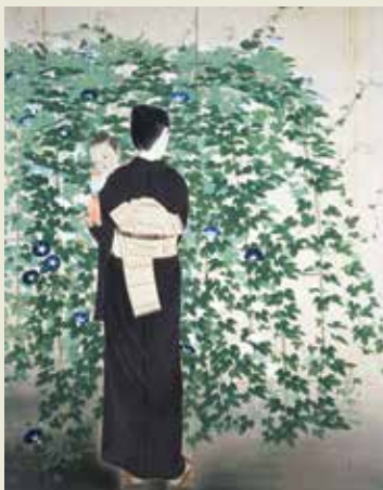
《朝露》1933年 耕三寺博物館所蔵 / 前期出品