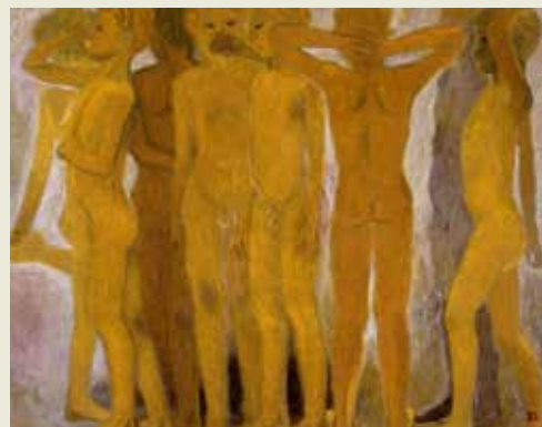
《少年群像》1950年 浜松市秋野不矩美術館所蔵 / 前期出品