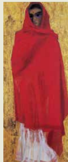
《インド女性》1964年 静岡県立天竜高等学校所蔵 / 前期出品

秋野不矩生誕110年に臨んで、今回、画業初期から晩年に至るまでの作品を通貫して展示し、自己の芸術を追い求めて邁進した秋野不矩の創作活動の道筋を振り返ります。（会期中、前期・後期で展示作品を総入れ替えます。）