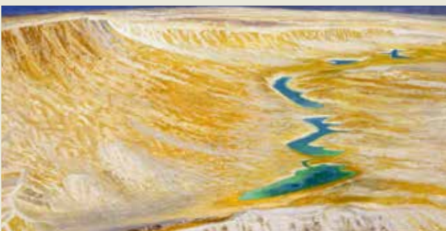
《カミの泉II》1976年 京都国立近代美術館所蔵 / 後期出品