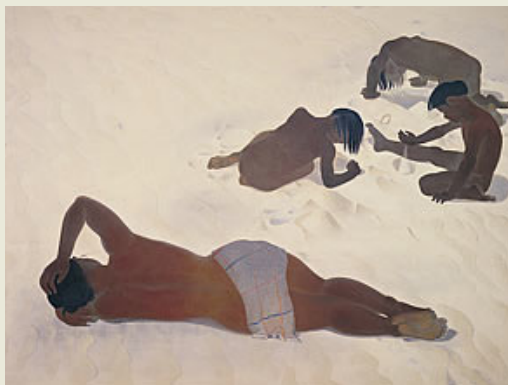
《砂上》1936年 京都市美術館所蔵 / 前期出品