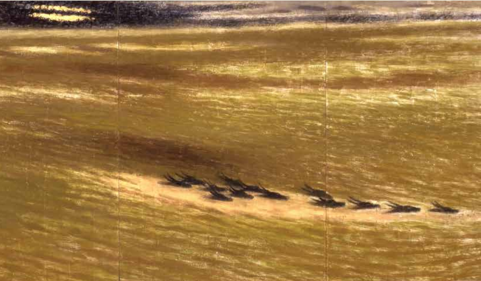
《渡河》(部分) 1992年 浜松市秋野不矩美術館所蔵 / 前期出品