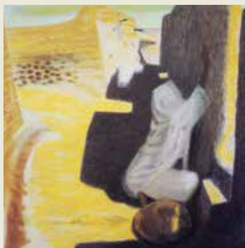
《壁を塗る》1984年 静岡新聞社所蔵（駿府博物館管理） / 前期出品