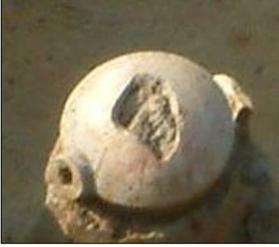
はそう(須恵器):竹などの管を 穴に挿して液体を注ぐ器