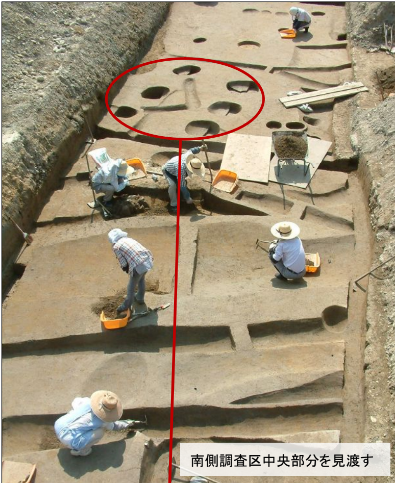
南側調査区中央部分を見渡す

6月2日から3か月の予定で開始した『上新屋遺跡』の発掘調査でしたが、地域の皆様の御理解と御協力を得て、8月末をもって無事終了することができました。