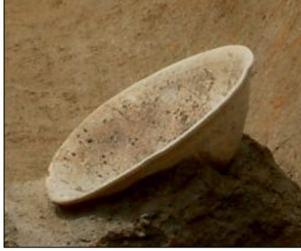
あぜの脇から出土した完全な形 の山茶碗(12世紀)