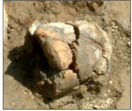
ふいごの羽口:ふいごから炉内 に風を送る管(粘土は熱せられ、 一部はガラス質になっている。)