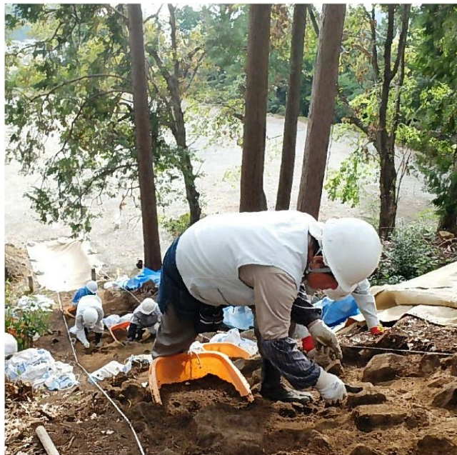
前方部斜面の調査状況 前方部斜面にも葺石がみられます。葺石の残存状況を確認するため、慎重に調査を進めます。