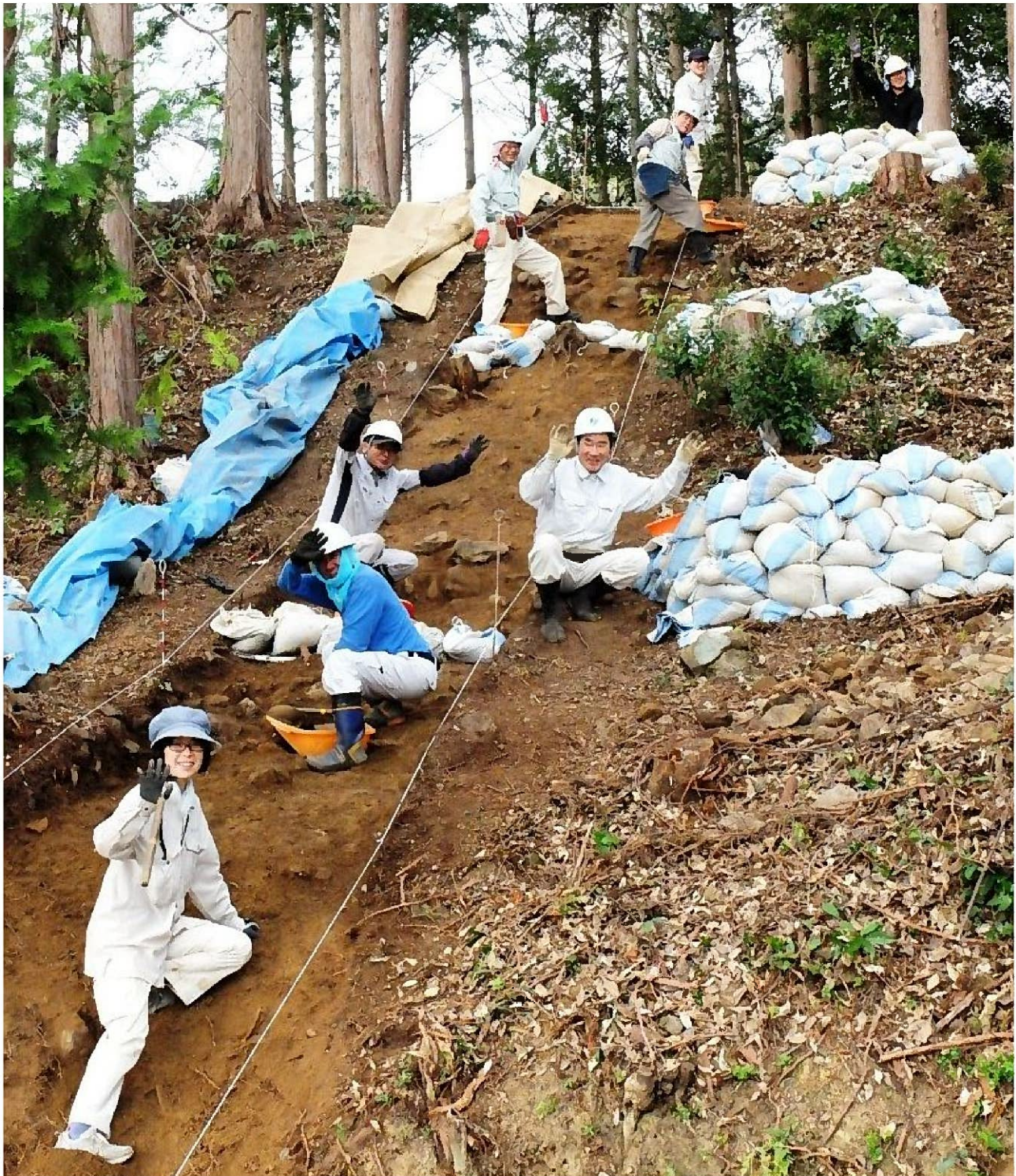
前方部の調査風景 前方部も後円部と同様、2段につくられていた可能性が高く、その詳細を探っています。

11月から光明山古墳の発掘調査を再開いたしました。今回の調査目的は、古墳の全長解明。後円部の先端と前方部の斜面及び先端に調査区を設け、正確な規模の把握を目指します。