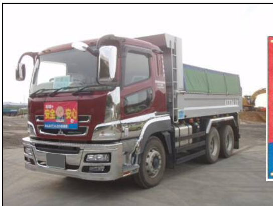
【CSG材(引佐材)運搬車両】