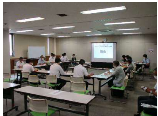
<第1回協議会の様子>

令和4年度第1回協議会において、各機関及び諸団体の代表である11名の委員で「浜松市いじめの防止等のための基本的な方針」について共通理解を図り、「行政そして家庭と学校と地域が連携して、いじめのない環境をつくり出す」ことを念頭に置きながら、当協議会を運営していくことが確認されました。議事の中で、浜松市教育委員会より令和3年度浜松市小中学校におけるいじめの認知件数や態様及び対策等について報告がありました。また、委員より各機関及び諸団体の取組について紹介されました。「いじめ防止対策推進法第30条第2項に基づく調査結果報告書（答申）」を受け、今後の協議会のあり方について等の協議が行われました。