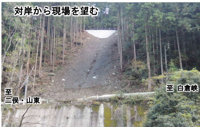
対岸から現場を望む