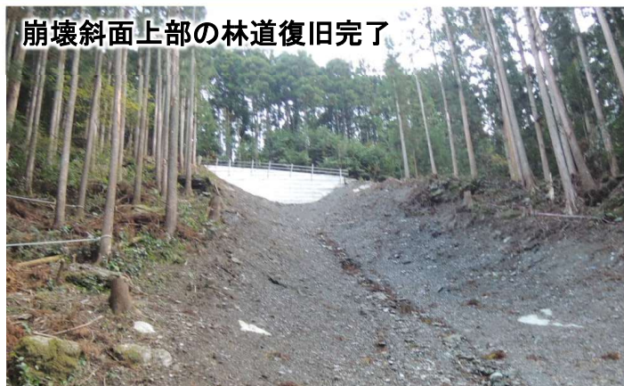
崩壊斜面上部の林道復旧完了