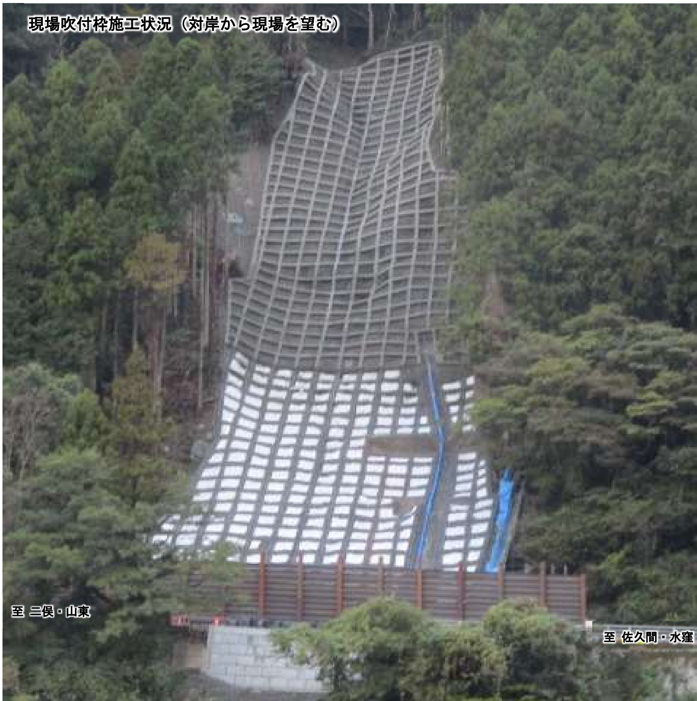
現場吹付砕施工状況 (対岸から現場を望む)