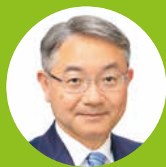
浜松市長 中野祐介

人生100年時代を見据え、本市は市民の皆様が病気を未然に予防し、いつまでも健康で幸せに暮らすことができる都市「予防・健幸都市」の実現を目指しております。