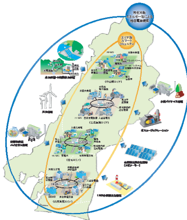
浜松市エネルギービジョン将来イメージ

そのため、エネルギー自給率を高める「再生可能エネルギー等の導入」、低炭素社会を実現する「省エネルギーの推進」、エネルギーを最適利用する「エネルギーマネジメントシステムの導入」、スマートシティ・浜松を技術的に支え地域経済を活性化する「環境・エネルギー産業の創造」をエネルギー政策の 4 本柱として、様々な事業に取り組みます。