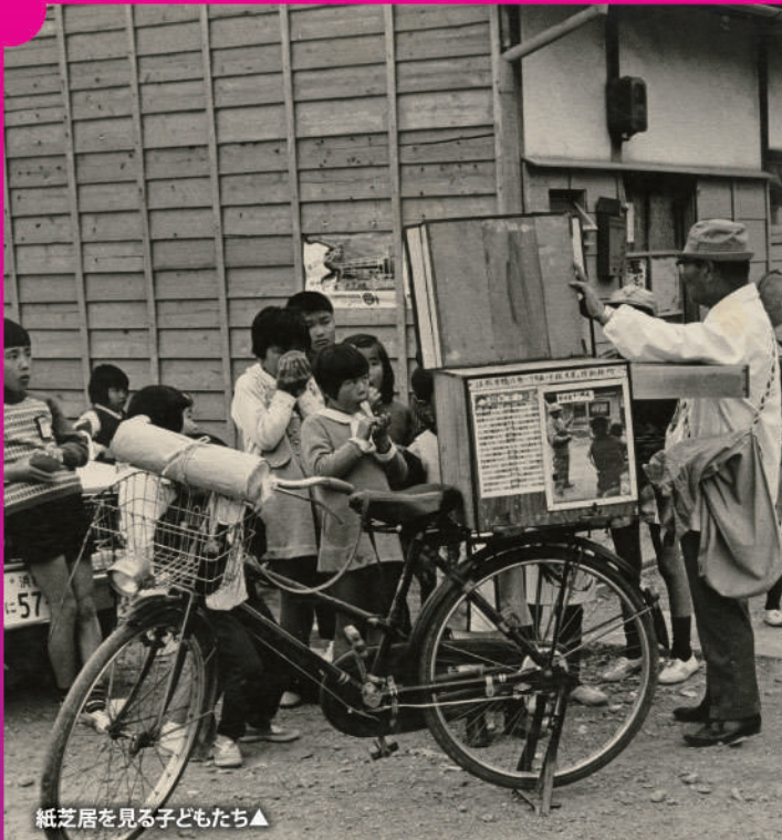
紙芝居を見る子どもたち▲

本展示を通して、地域の歴史に触れていただくとともに、当館の資料収集活動についてご理解いただく機会にさせていただきます。