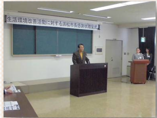
活動内容報告の様子

受賞された皆様、おめでとうございます。今後も地域の模範として、引き続き活動の継続をお願いするとともに、環境美化等への変わらぬご理解・ご協力をよろしくお願いします。