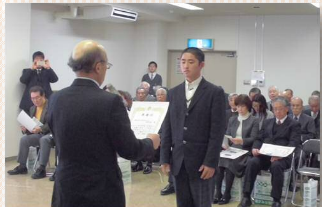
感謝状贈呈の様子