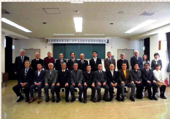
受賞者及び来賓の皆様