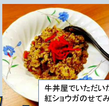
牛丼屋でいただいた紅ショウガのせてみました