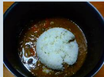
今回は食べかけの鍋ですカレー食べ飽きたので・・・