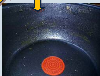
ご馳走さまでした鍋を洗うのが楽でした