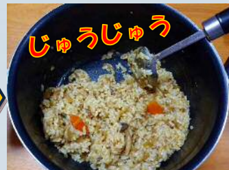
食べ飽きたはずなのに焼くといい香りが・・・