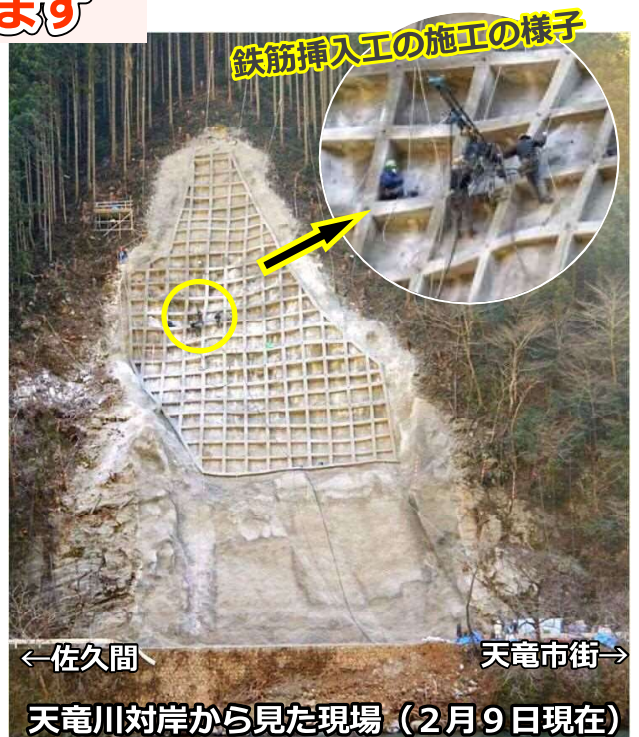
天竜川対岸から見た現場（2月9日現在）