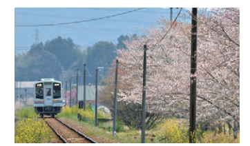
遠鉄バスコールセンター ☎053-455-2255 天竜浜名湖鉄道 ☎053-925-2276

お得に周遊 「いいね!直虎1DAYパス」 「1日フリー乗車券」、「龍潭寺拝観券」、「大河ドラマ館入場券」がセットに。遠鉄バスと遠州鉄道、天竜浜名湖鉄道に1日乗り放題で2,300円(個別購入すると4,340円)。電車やバスで、龍潭寺や大河ドラマ館をめぐるのに便利。販売:遠州鉄道各窓口・遠州鉄道有人駅・天竜浜名湖鉄道有人駅