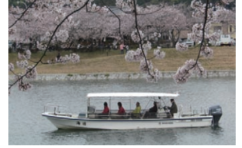
NPO法人 浜名湖観光地域づくり協議会 ☎053-487-0152

かんざんじ温泉からは「大河ドラマ館直行船」で かんざんじ温泉桟橋と、大河ドラマ館近くの気賀桟橋をつなぐ直行船。湖上から見る絶景を満喫しながら約25分間の船旅を。乗船代1,200円(片道)。5月からは、大人数が乗船できる浜名湖遊覧船も就航予定。