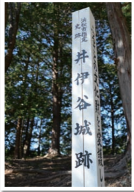
井伊谷城跡 標高約115m、丘陵に築かれた井伊氏の城館。井伊氏の本拠地は井伊谷城とその山麓にあった居館に加え、最終的な詰め城である三岳城で構成されていた。現在では城山公園として整備されており、土塁などの遺構が見学できる。

許婚との別れと出家 直虎(幼名・生年月日不明)は、井伊家当主 井伊直盛と新野左馬助親矩の妹との間に誕生した一人娘とされている。直盛には嫡男がなく、従弟の亀之丞(後の井伊直親)を一人娘の許婚とし、井伊家の跡継ぎにする予定だった。ところが、天文13年(1544)、亀之丞の父・直満が今川義元に謀反の嫌疑をかけられ殺された上に、当時9歳だった亀之丞までも命を狙われ、信濃(長野県)の松源寺に身を隠すことになる。