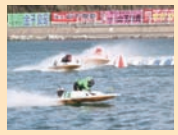
表紙撮影/はままつ地ビール工房 マイン・シユロス

ゆかた姿の表紙モデルは、浜名湖ポートレース場をホームプールとし、全国を転戦する現役女子ポートレーサー。時には男子レーサーとも激しい水上バトルを繰り広げるお二人の可憐なゆかた姿は、8ページ以降に続きます。