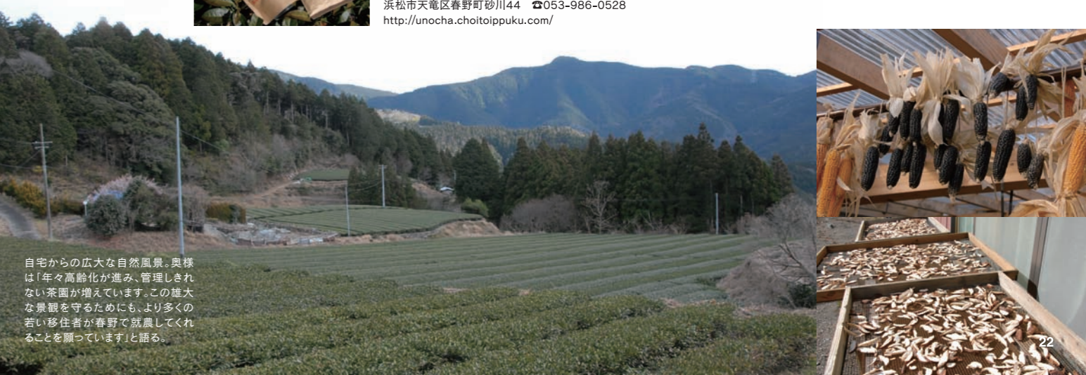
自宅からの広大な自然風景。奥様は「年々高齢化が進み、管理しきれない茶園が増えていきました。この雄大な景観を守るためにも、より多くの若い移住者が春野で就職してくれることを願っています」と語る。