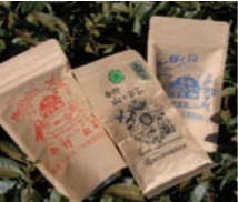
[DATA] うの茶園 浜松市天竜区春野町砂川44 ☎053-986-0528 http://unocha.choitoippuku.com/

憧れだった自給自足の生活。子育て環境にも最適 健康の面でも大きなメリットがありますね。特に育児をするには最高の環境です。忙しい時は近くのおばあちゃんや子どもの面倒を見 てくれますし、食事は畑で育てたお米や野菜を自給自足しています。たまの飲み会とかで都市部に出たりすると、油や塩分・添加物がたくさん入っているものも食べます。嫌いではないんですが、ただ、不調になることもしばしば。私(夫)は「邪食」と呼んでいます(苦笑)。季節と自然に寄り添った食生活を当たり前のように続けられる環境は私たちの理想でしたから、とても快適ですね。風邪も引かなくなり、家族全員すこぶる元気です。