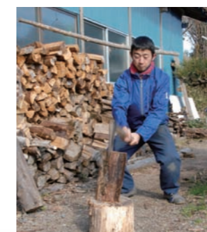
自然に負荷をかけない暮らし方を求め、バイオトイレや薪ボイラー・太陽熱温水器を駆使して、忙しく暮らしている。薪割りもお手の物。

く縁のない土地でしたが、見渡す限り自然が充実していて、茶園風景とのコントラストがとても美しく、標高400mの土地なので空気も澄んでいます。地域の人は高齢者を中心ですが、みなさん温厚な性格で、見ず知らずの私たちにもすくく親切にしてくれました。現在は約40戸の農家で構成されている「マルセン砂川共同製茶組合」という組合に加盟して共同茶工場の運営に携わりながら、お茶の小売をするために「うの茶園」を立ち上げ、オリジナルの烏龍茶や紅茶なども生産販売しています。