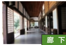
廊下 本堂の廊下は伝左基五郎作の鶯張り。書院内には織田信長公の遺品や井伊家拝領の貴重な品が展示されている。