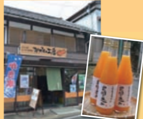
三ヶ日みかんジュース「農園の恵み」880円(720ml)

三ヶ日みかんの生産だけでなく、旬な時期の一番おいしいみかんを使った加工品を製造、販売。全国各地から注文が入り、贈答用として利用する方も多いそう。浜松土産として喜ばれるはず。