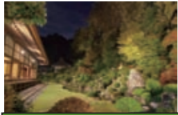
秋の庭園ライトアップ

龍潭寺は奈良時代の733年に行基菩薩により創建された、遠州でも古刹のお寺。徳川幕府の譜代大名の筆頭として活躍した井伊家の菩提寺として、千年の菩提を祀る。境内には2017年大河ドラマの主役である井伊直虎のお墓も。東海一の名園ともいわれる、小堀遠州作の国指定名勝庭園や多くの文化財を有し、奥浜名湖の歴史と文化を現代に伝えている。