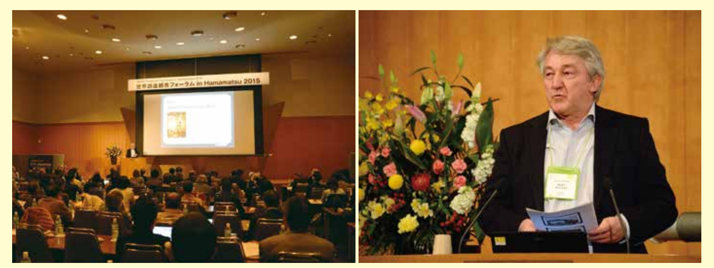
スーパープレゼンテーション Super-presentations ゲント Ghent