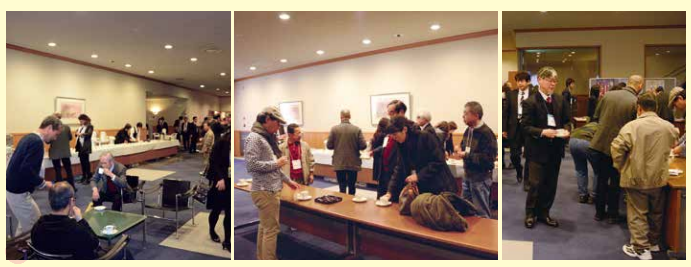
コーヒーブレイク Coffee Break