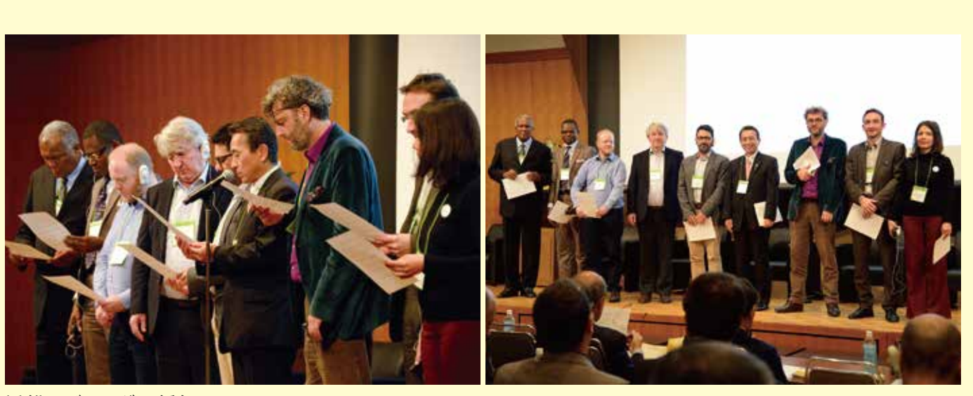
浜松アジェンダの採択 Adoption of the Hamamatsu Agenda