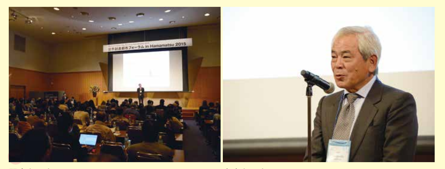
開会あいさつ Opening Address