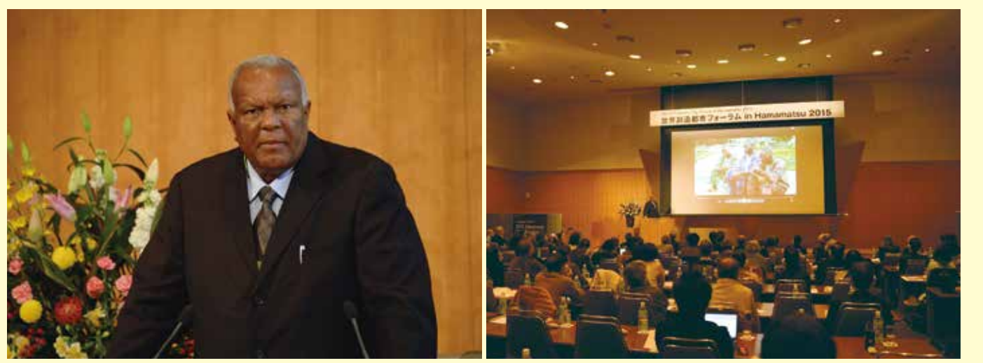
スーパープレゼンテーション Super-presentations ブラザヴィル Brazzaville