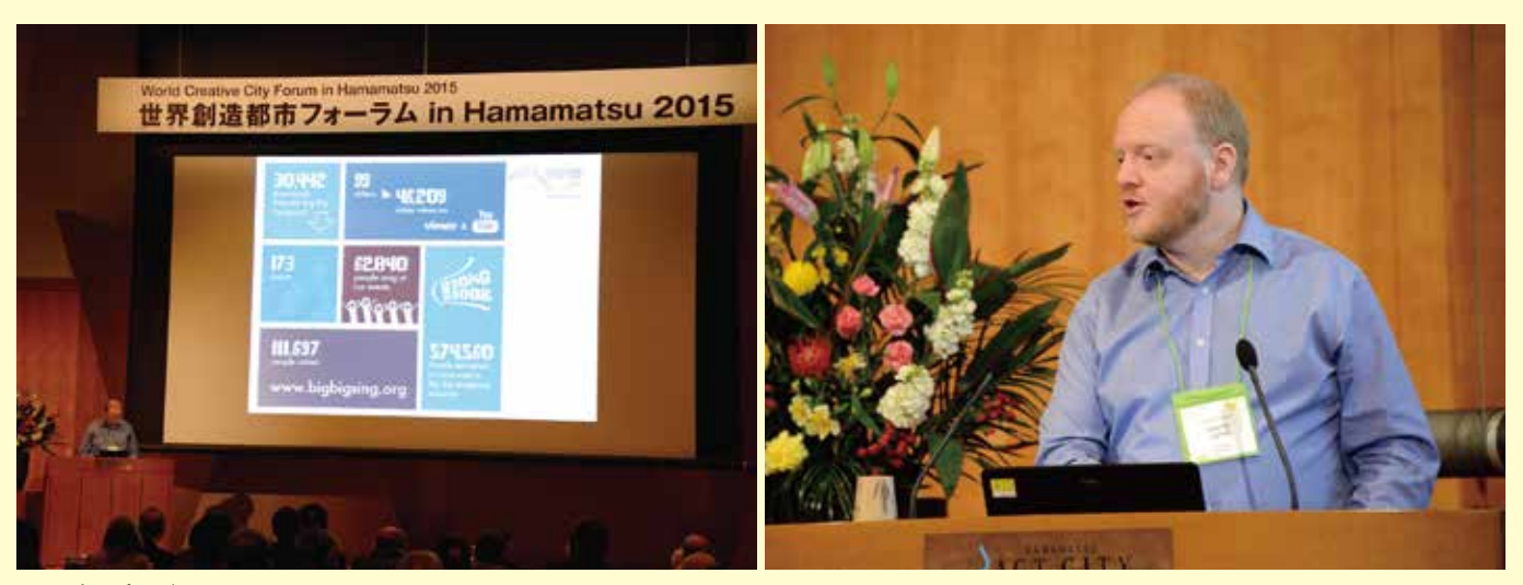
スーパープレゼンテーション Super-presentations グラスゴー Glasgow