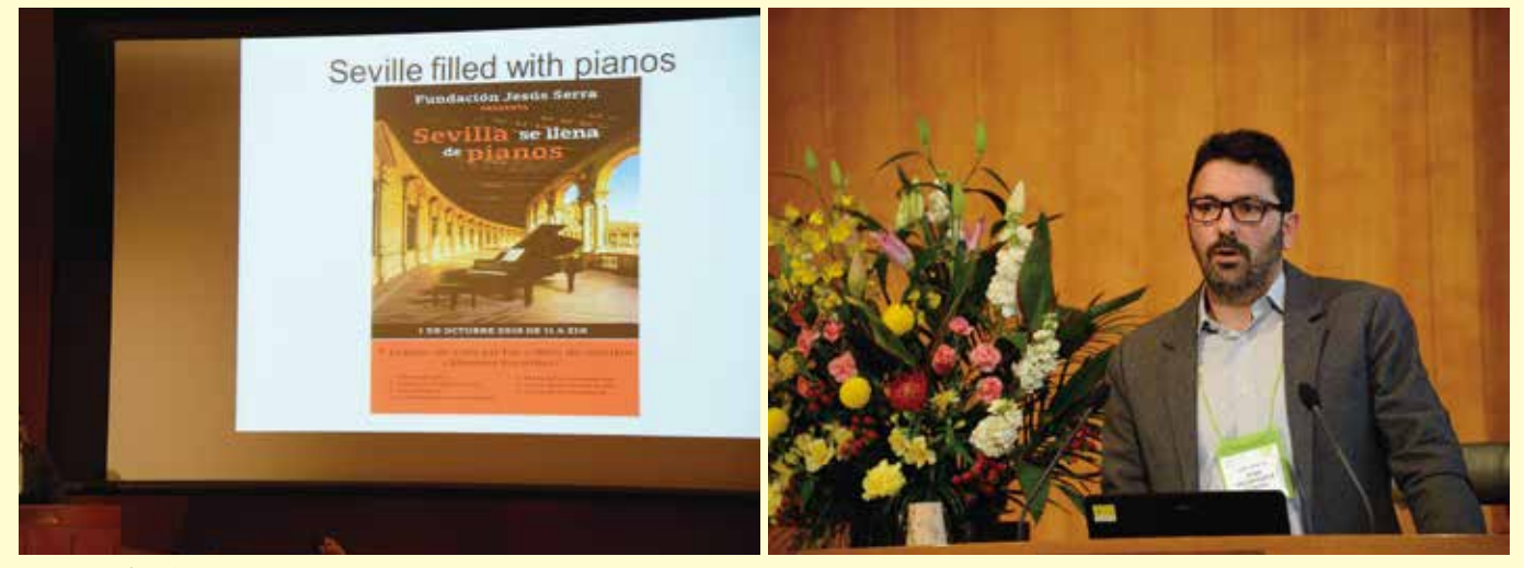
スーパープレゼンテーション Super-presentations セビリア Seville