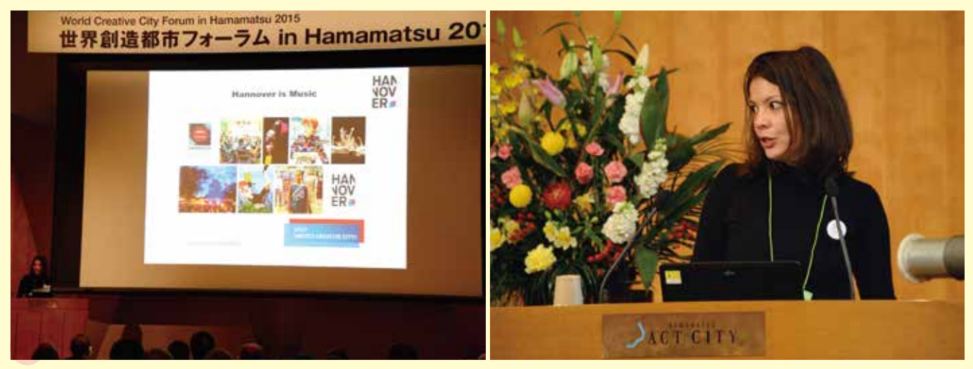
スーパープレゼンテーション Super-presentations ハノーバー Hannover