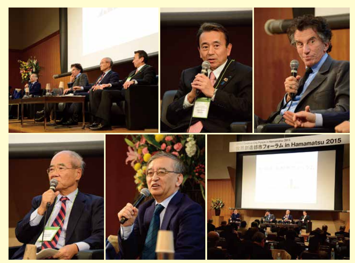
スペシャルトークセッション Special Talk Session