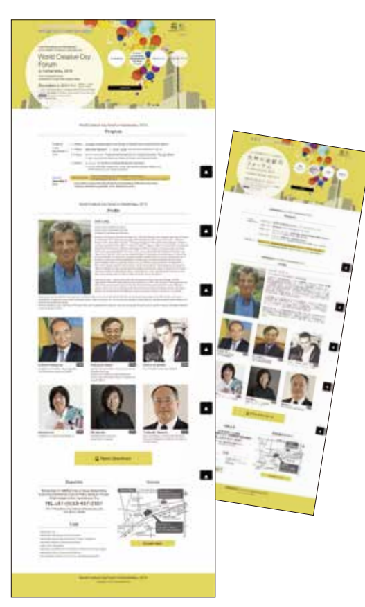
▲公式ホームページ Official website