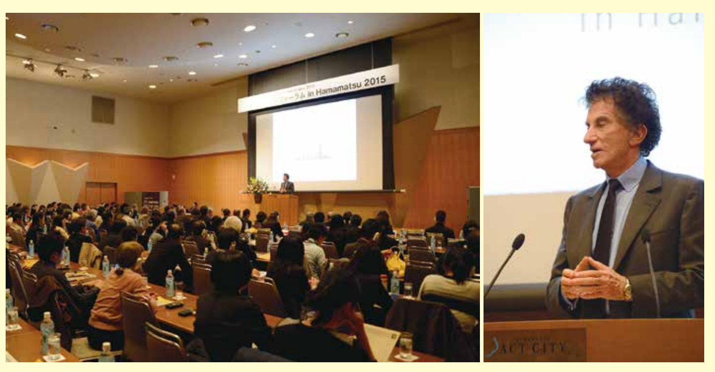
基調講演 Keynote Speech