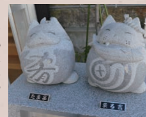
「二礼、二拍手、一ニヤン」で福を呼ぼう。