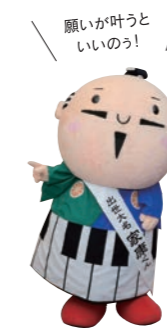
願いが叶うといいのう!