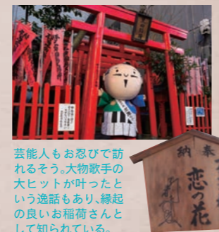
芸能人もお忍びで訪れるそう。大物歌手の大ヒットが叶ったという逸話もあり、縁起の良いお稲荷さんとして知られている。

有楽街の入り口という好立地から、通りがかりの若者の参拝者も多いというお稲荷さん。明治6年に廃寺処分を受けたが、地元民たちの信仰熱意によりお稲荷様は残され、代々受け継がれてきた。五穀豊穡・商売繁盛・家内安全にご利益をもたらす神様は、街の人々を日々見守ってくれている。浜松市中区鍛冶町 有楽街南口