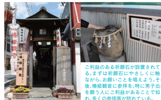
ご利益のある祈願石が設置されている。まずは祈願石にやさしく触れながら、お願いごとを唱えよう。その後、椿姫観音に参拝を。特に男子出生を願う人にご利益があることで知られ、多くの参拝者が訪れている。