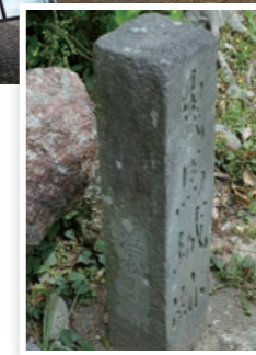
鳥居の横には「曳馬城址」と刻まれた史跡碑と、家康公時代の引間城本丸跡に関する解説絵図の看板がある。