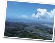
まるで風と一体になった気分！

浜松市北区三ヶ日町大谷93-1 TEL.053-526-0015 料金：体験フライト(タンテム)8,400円 期間：4～10月 http://www.jpmsports.com/