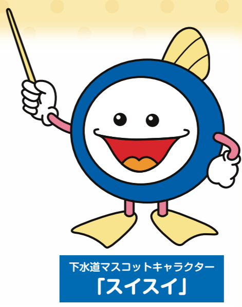
下水道マスコットキャラクター「スイスイ」

みんなが使った水は、下水道管を通して「浄化センター」というところできれいにしているんだ! 浜松にあるいろんな「浄化センター」の中から、お気に入りの一つを見つけてみよう!