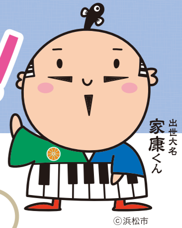
出世大七 家康くん