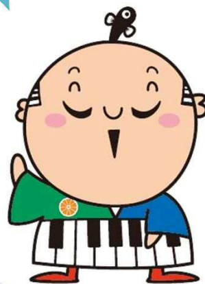
出世大名 家康くん