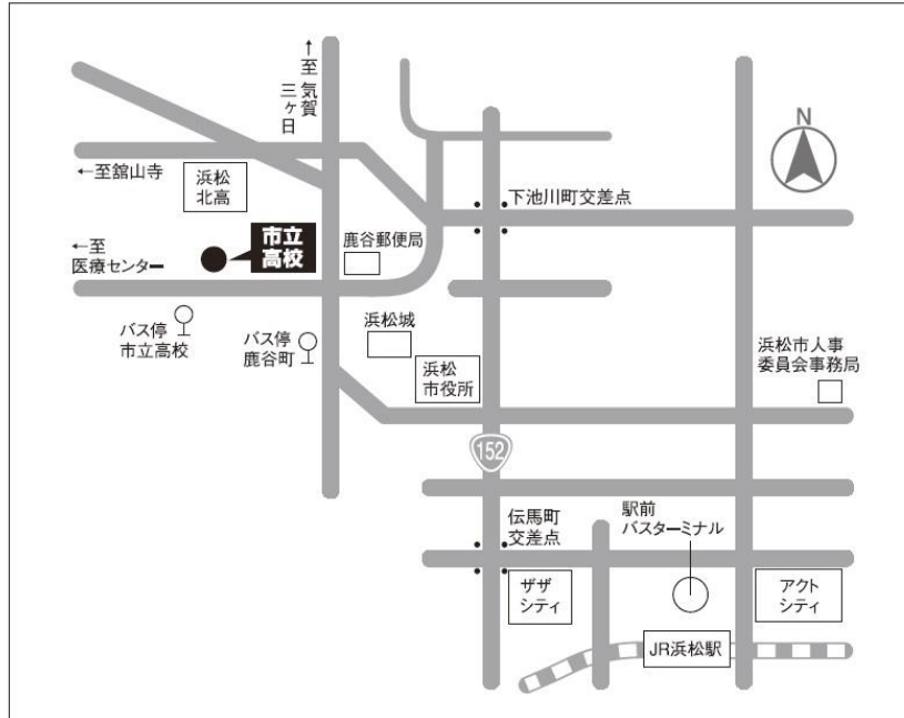
浜松市立高等学校(浜松市中区広沢一丁目21-1)