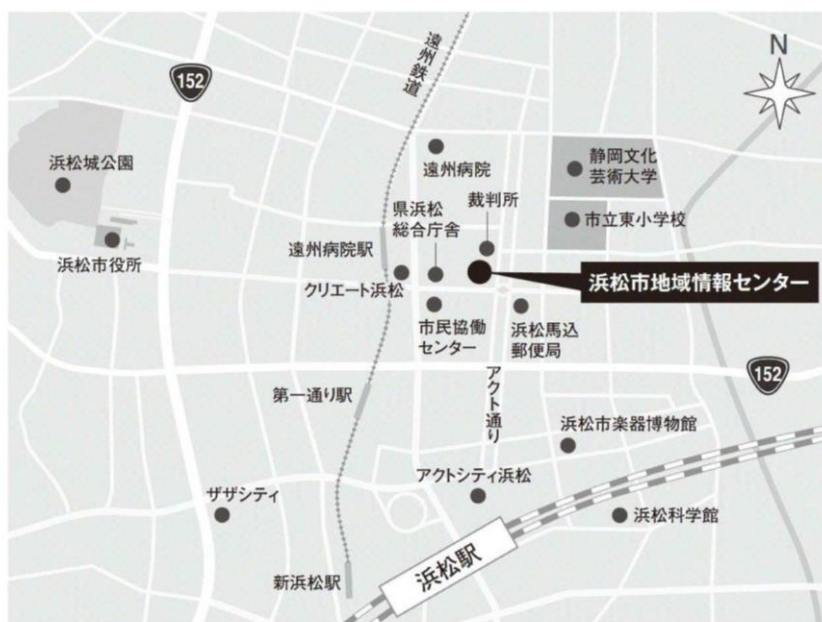
浜松市地域情報センター (浜松市中区中央一丁目 12-7)