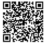
LINE 公式アカウント （職員採用情報）