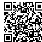
浜松市 HP (職員採用)

新型コロナウイルス感染症や災害等の理由により試験の実施について変更などがある場合は、浜松市ホームページ(トップ→職員採用)および LINE 公式アカウントでお知らせします。 確実に情報を受信いただけるよう、LINE 公式アカウントの登録をお願いいたします。